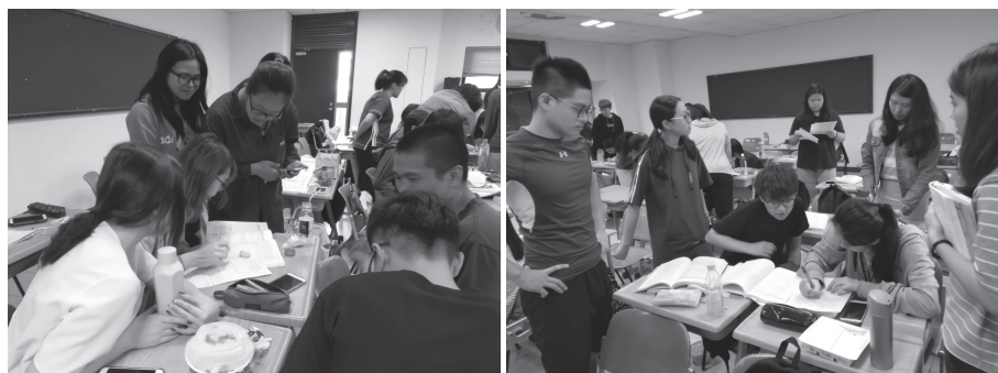
圖3 影片觀後小組討論剪影

在質性資料的蒐集及分析中，顯示實施「學思達」教學策略於問卷調查、開放性問答題、心得作業、反思日誌等學習成效的評量呈現的是一致性結果。雖然在「老人溝通」單元，學生的抱怨聲未曾間斷，作業的執行及完成度較為費力困難，是吃力不討好的教學活動之一，但量化問卷結果呈現的卻是正向的，學生肯定「與老人溝通訪談」的教學方案，在質性資料更證實了教學策略能達到實務教學及應用關懷老人的目標。影片觀賞的教學帶給學生許多的震撼與思考。學生表露出對失智症疾病帶來的威脅及照顧上滿滿的無力感，同時也對失智症症狀有深刻的理解。影片觀後小組討論剪影如圖3所示。「學思達」教學法的教學理念，將學習的知識與學生生命、處境和現實發生關聯，達到教學研究目的，強化學生專業智能之培育，展現同理關懷老人，增進提升課程學習興趣及溝通能力之教學目標。